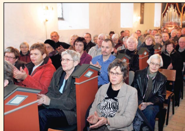
Publikum skulle også arbejde i lørdags og deltog i flere af sangene.