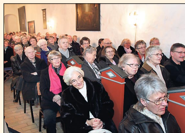
Der var fyldt helt op i Thorning Kirke i lørdags.

Sangene - de handler om skyld, om ensomhed,